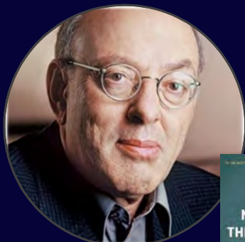
Henry Mintzberg Professor i management