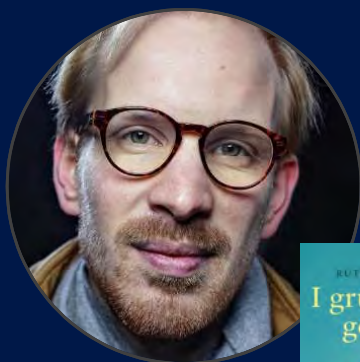
Rutger Bregman Historiker och författare