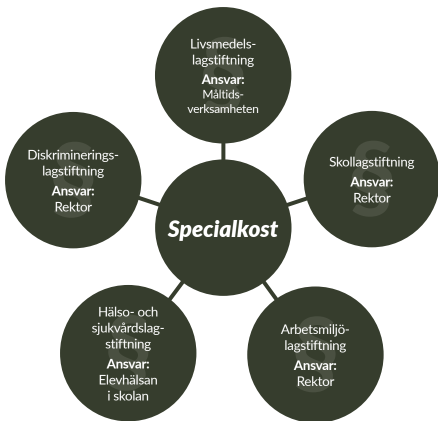
Figur 1: Lagstiftning och ansvar rörande specialkost i förskola och skola.