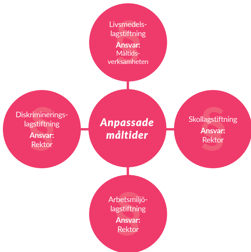
Figur 2: Lagstiftning och ansvar rörande anpassade måltider.